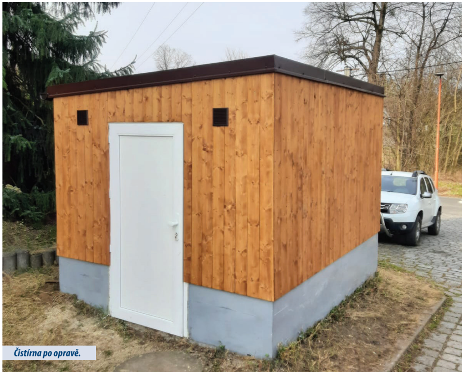
Čistírna po opravě.

jsou svedeny splaškové vody objektu základní školy a z bytového domu čp. 900. Čistírna byla zkolaudována v roce 2002.