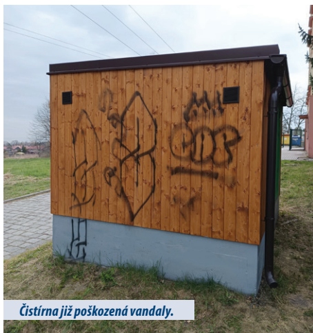
Čistírna již poškozená vandaly.