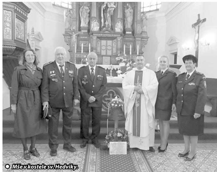
○ Mše v kostele sv. Hedviky.