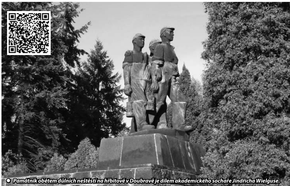
○ Památník obětem důlních neštěstí na hřbitově v Doubravě je dílem akademického sochaře Jindřicha Wielguse.

Letos v únoru vzpomeneme 75. výročí od tragédie na dole Doubrava. Ve spolupráci s obcí Doubrava a OKD, a.s. se bude konat v úterý 13. 02. 2024 od 10:30 pietní akt u Památníku obětem důlních neštěstí na hřbitově v Doubravě.