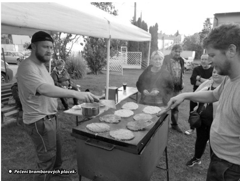
● Pečení bramborových placek.