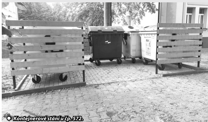
● Kontejnerové stání u č.p. 572.