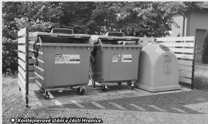
● Kontejnerové stání v části Hranice.