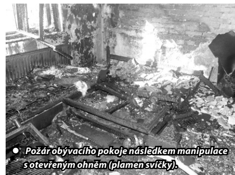
● Požár obývacího pokoje následkem manipulace s otevřeným ohněm (plamen svíčky).