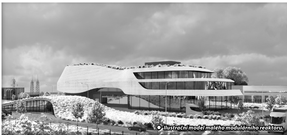
● Ilustrační model malého modulárního reaktoru.