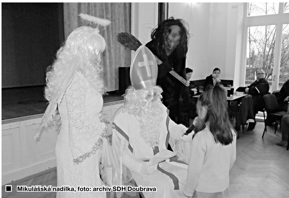
■ Mikulášská nadílka

Dagmar Rentová, matrika, evidence obyvatel