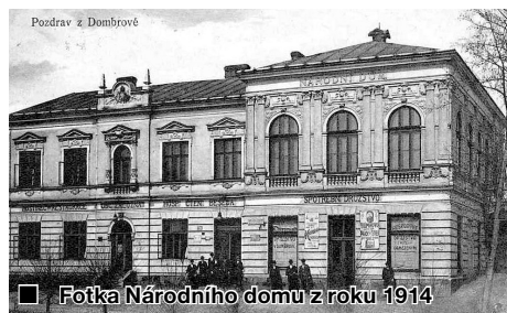
Fotka Národního domu z roku 1914

30. 10. 1898 ustavila dvaatřicetiletá valná hromada Sbor dobrovolných hasičů.