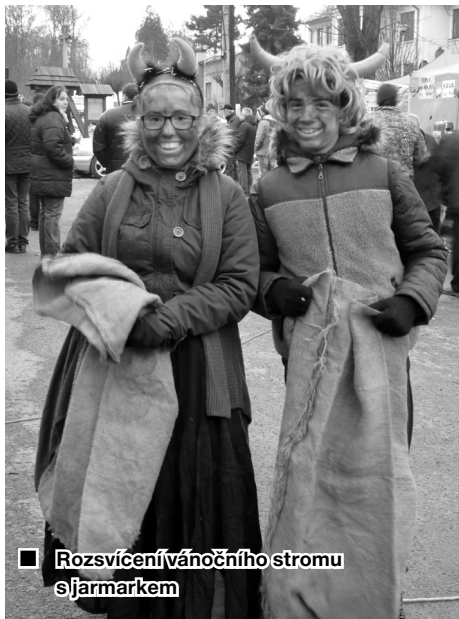
■ Rozsvícení vánočního stromu s jarmarkem