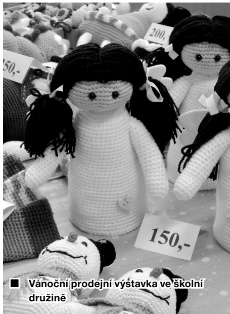
■ Vánoční prodejní výstavka ve školní družině

Ušebno nejlepší do nového roku 2017 všem našim čtenářům! Pevné zdraví, bodně pobody a radosti. Vedení obce a redakce Obecního zpravodaje