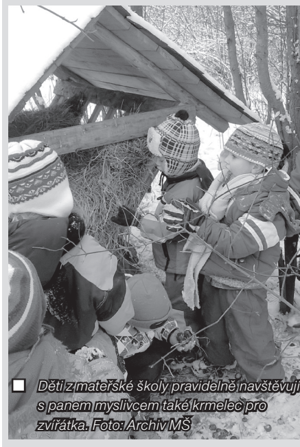
■ Děti z mateřské školy pravidelně navštěvují s panem myslivcem také krmelec pro zvířátka.