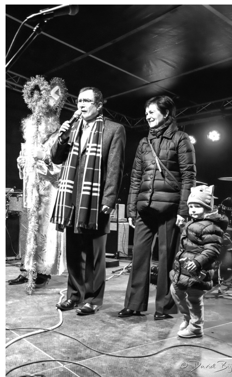
■ Rozsvícení vánočního stromu.