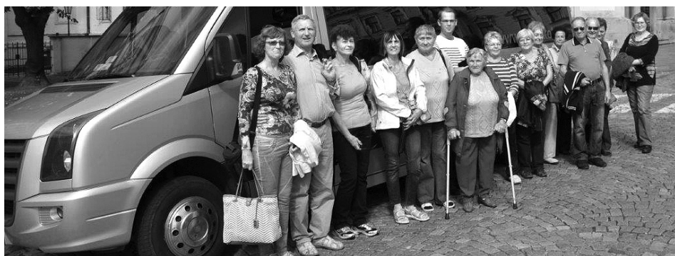
■ Výlet do Kroměříže, září 2015