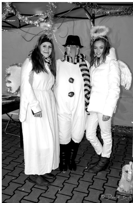
■ Ježíškova pošta – rozsvícení vánočního stromu.

Advent v Doubravě byl opět nabitý kulturou. Vánoční tvořivé dílny, prodejní výstavka, mikulášská nadílka, rozsvícení vánočního stromu s jarmarkem, vánoční pohádka dětí z mateřské školy, adventní koncert nebo zpívání u vánočního stromu. Jsme rádi, že i v tak malé obci se daří zachovat bohatý kulturní a spolkový život a děkujeme všem organizacím a spolkům, které se o to každý rok snaží a Nadaci OKD, která již několik let kulturní a společenský život v obci finančně podporuje. Více fotografií z nejen adventních akcí naleznete na www.doubrava.cz a na obecním facebooku. ŠH