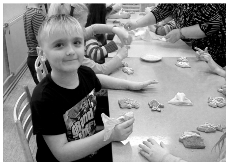
■ Malování perníčků v ZŠ Doubrava.

Advent v Doubravě byl opět nabitý kulturou. Vánoční tvořivé dílny, prodejní výstavka, mikulášská nadílka, rozsvícení vánočního stromu s jarmarkem, vánoční pohádka dětí z mateřské školy, adventní koncert nebo zpívání u vánočního stromu. Jsme rádi, že i v tak malé obci se daří zachovat bohatý kulturní a spolkový život a děkujeme všem organizacím a spolkům, které se o to každý rok snaží a Nadaci OKD, která již několik let kulturní a společenský život v obci finančně podporuje. Více fotografií z nejen adventních akcí naleznete na www.doubrava.cz a na obecním facebooku. ŠH