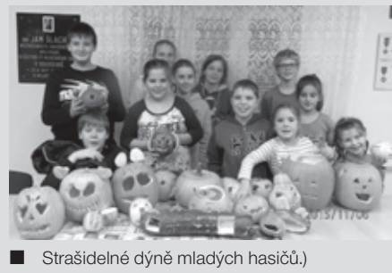
■ Strašidelné dýně mladých hasičů.