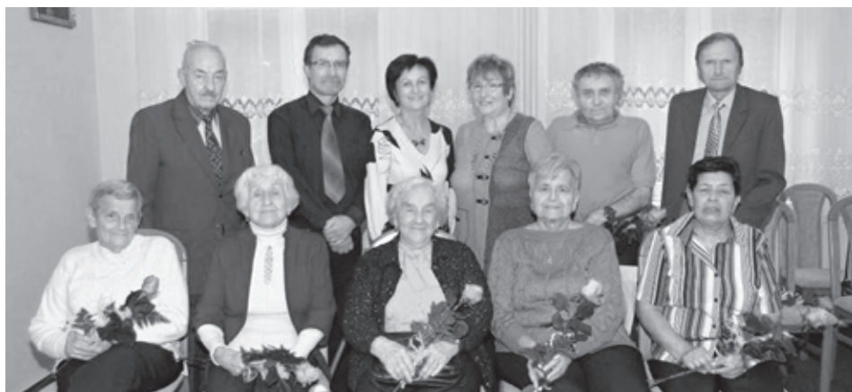
■ Setkání jubilytů