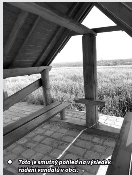
● Toto je smutný pohled na výsledek řádění vandálů v obci.