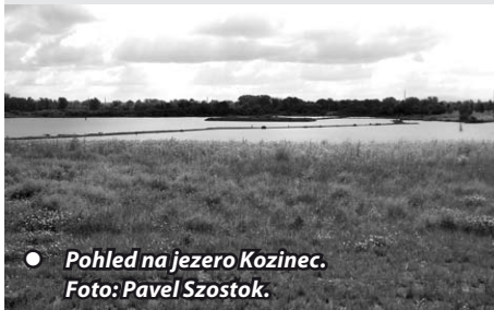
● Pohled na jezero Kozinec.

Vážení spoluobčané, máme za sebou první půlrok, na který nikdo nezapomeneme. Stále musíme mít na vědomí, že riziko nákazy nemocí Covid-19 způsobené koronavirem neskončilo, a proto musíme být stále obezřetní. Letní měsíce již tradičně patří k období, kdy si plánujeme dovolenou k odpočinku a načerpání nových sil. Všem našim občanům přeji, aby se naplnila Vaše přání a v případě, že cestování vyměníte za pobyt v Doubravě, věřím, že oceníte její kouzlo. K tomu určitě přispěje otevření komunikace pod Ujalou a snadnější napojení na cyklostezku s nádhernými výhledy na jezero Kozinec.