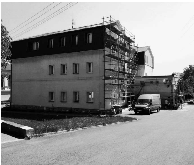
● Práce na opravě fasády začaly již v průběhu měsíce května.