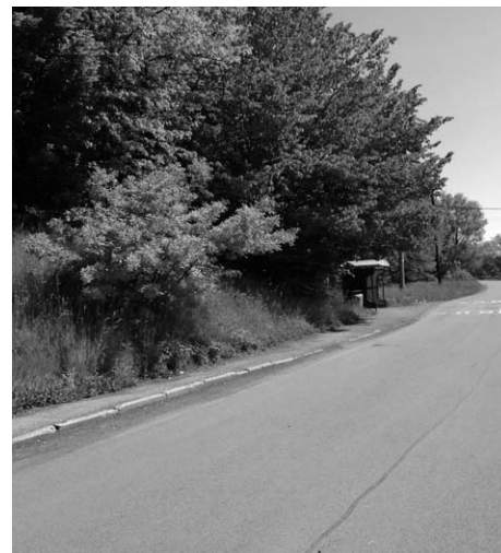
● Oprava chodníku od zastávky Doubrava.

V současné době čekáme na rozvolnění přísných opatření, která souvisejí s pandemií. K dodržení stávajících platných hygienických nařízení nemáme v obci dostatečně velké prostory. Veřejné projednání změny č. 1 Územního plánu Doubravy připravuje odbor územního plánování MěÚ Orlová. Jakmile bude znám termín veřejného projednání, budeme o něm v řádném předstihu informovat prostřednictvím veškerých možných informačních kanálů.