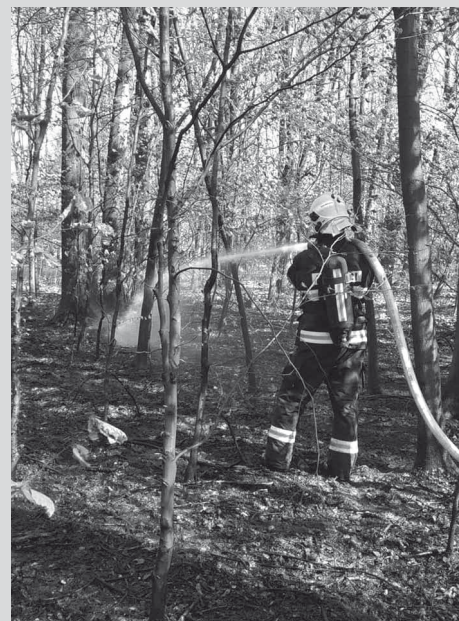
● Zásah doubravských hasičů u požáru lesního porostu.

uskutečnilo také, vše ale za omezeného množství lidí tak, jak to umožnila aktuální opatření.