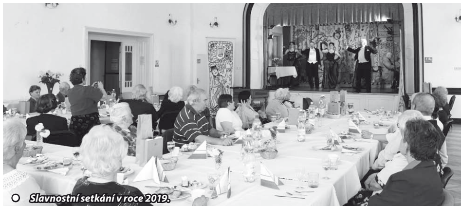
○ Slavnostní setkání v roce 2019.