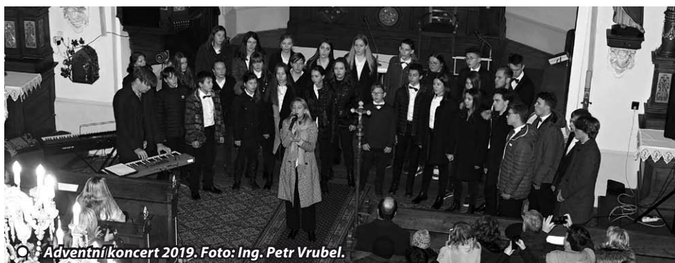
Adventní koncert 2019.