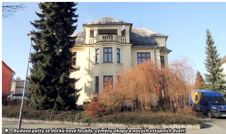
● Budova pošty se dočká nové fasády, výměny okapů a nových vstupních dveří.

Ve výhledu je oprava podlah v základní škole . Byla zpracována projektová dokumentace, abychom byli připraveni pro podání žádosti na dotaci, kterou Ministerstvo pro místní rozvoj pro rok 2020 připravovalo (pokračování na straně 2)