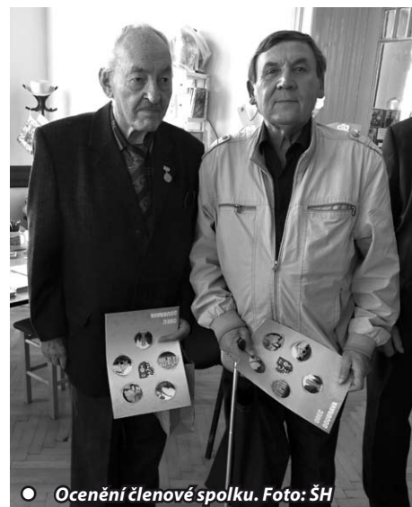
● Ocenění členové spolku.