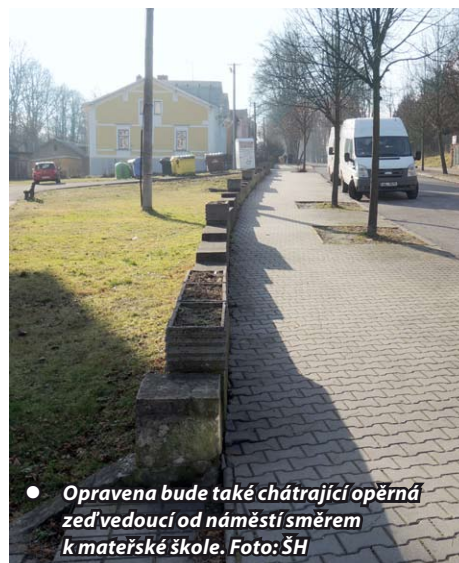
● Opravena bude také chátrající opěrná zeď vedoucí od náměstí směrem k mateřské škole.