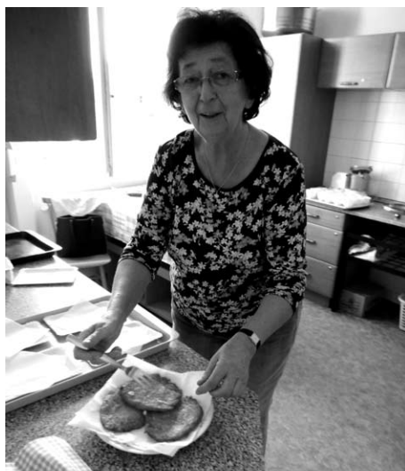
○ Smažení bramboráků.