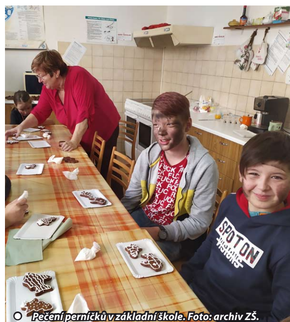
○ Pečení perníčků v základní škole.