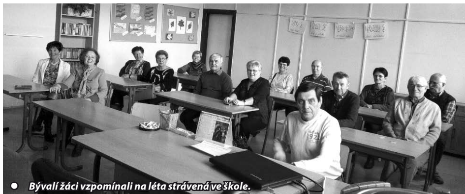
● Bývalí žáci vzpomínali na léta strávená ve škole.