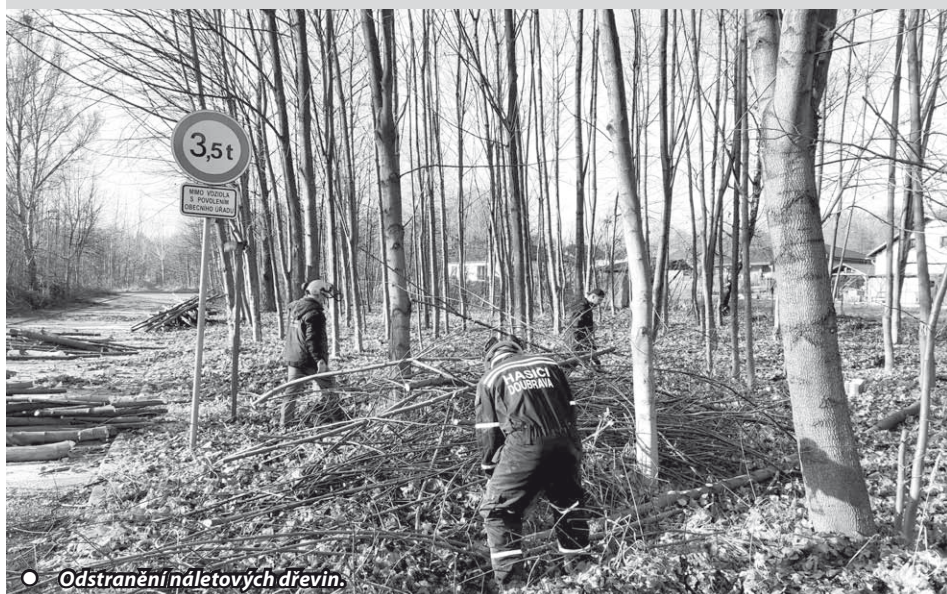
• Odstranění náletových dřevin.