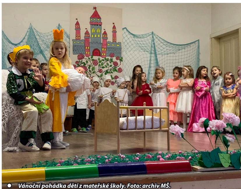
● Vánoční pohádka dětí z mateřské školy.