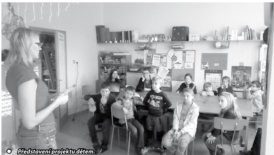
○ Představení projektu dětem.