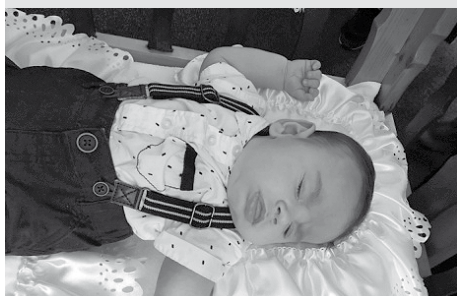
Blahopřejeme k narození děťátka!