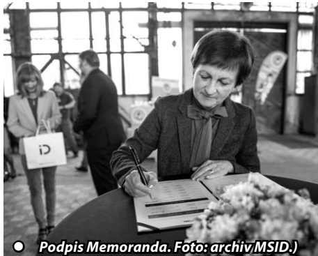
● Podpis Memoranda.