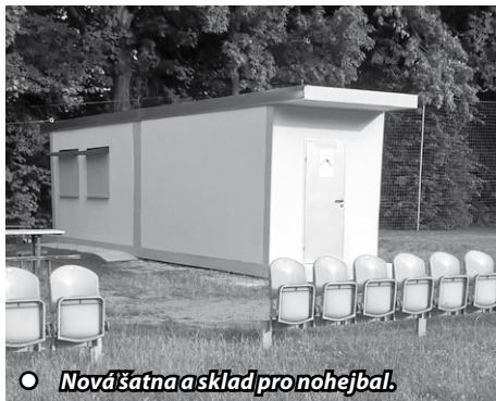
Nová šatna a sklad pro nohejbal.