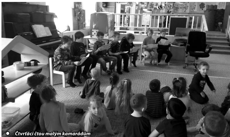
● Čtvrtáci čtou malým kamarádům