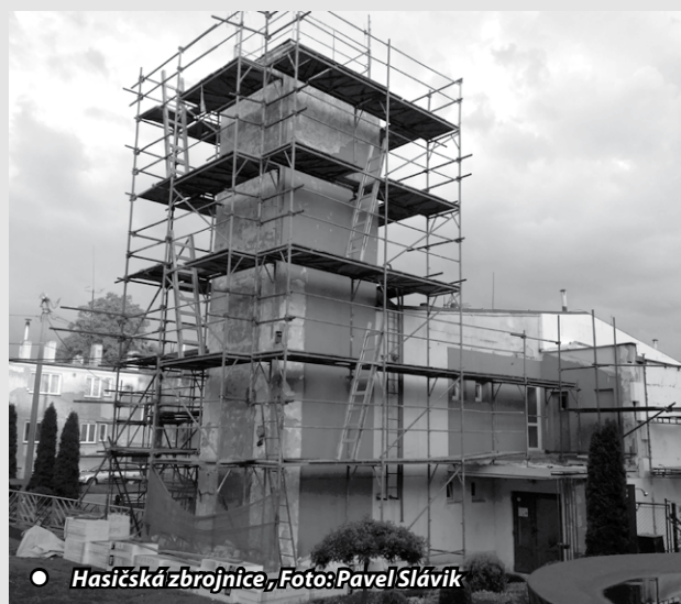
● Hasičská zbrojnice, Foto: Pavel Slávik

řízení Oranžový přechod 2019 v částce 112 927 Kč. V letošním roce bude vybudován osvětlený přechod pro chodce před mateřskou školou a následně budeme