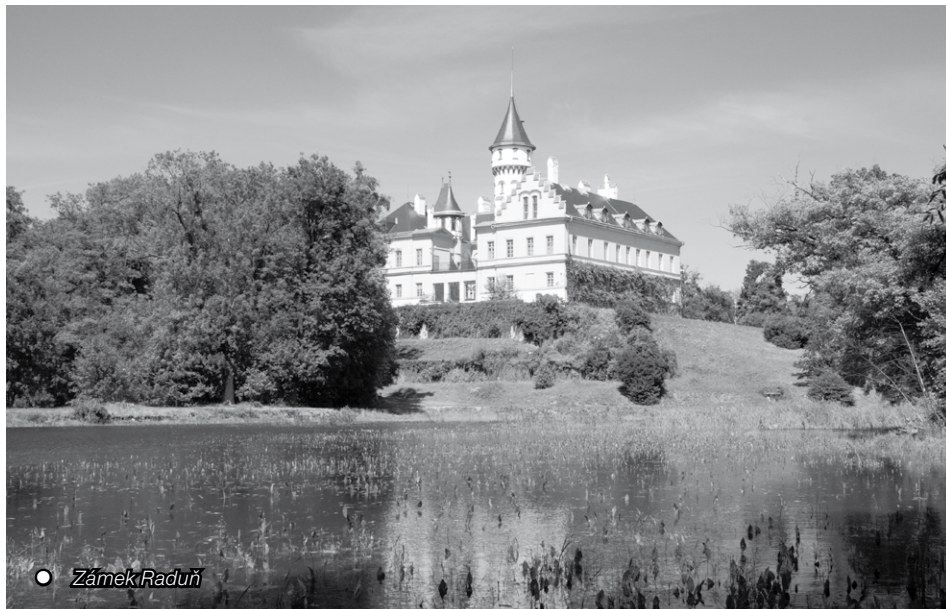
● Zámek Raduň

OSLAVA 15 LET MOBILNÍHO HOSPICE ONDŘÁŠEK Velký koncert pro velká srdce 27. 04. 2019 od 16:30 hodin, aula GONG v Dolních Vítkovicích