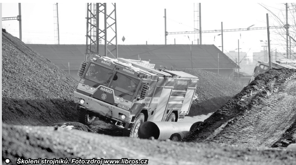
● Školení strojníků.

tradičního „pekla“, až po prodej lístků do půlnoční tomboly a samozřejmě všem hostům, kteří náš ples navštívili.