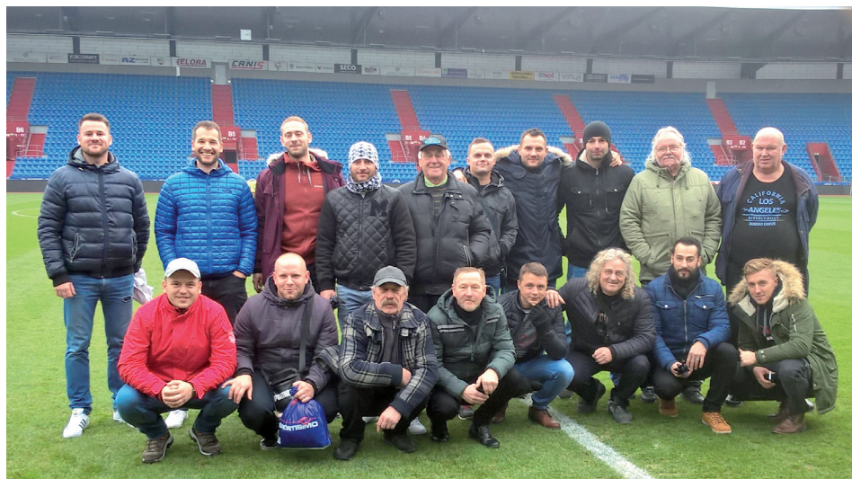
• Členové Baníku Doubrava na hřišti FC Baník Ostrava.