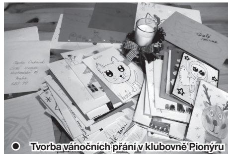
● Tvorba vánočních přání v klubovně Pionýru