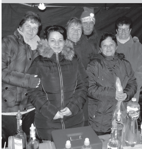
● Organizační tým hasičského stánku na vánočním jarmarku.