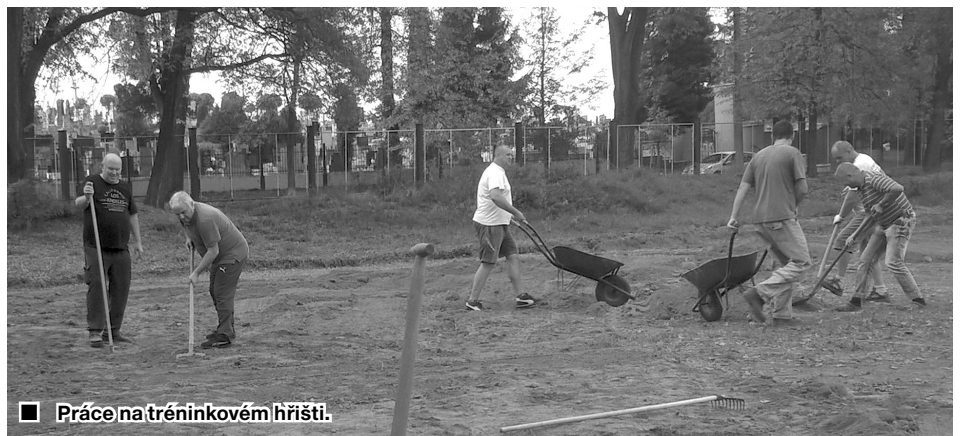
■ Práce na tréninkovém hřišti.