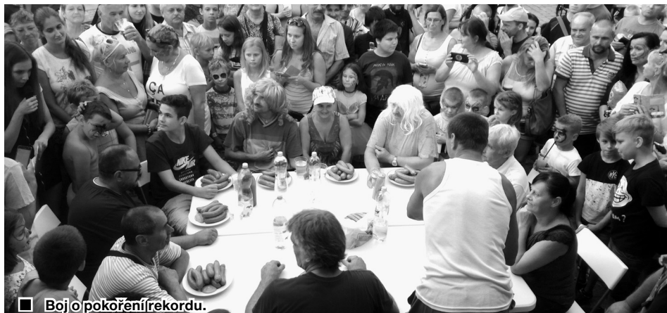
■ Boj o pokoření rekordu.

Poděkování patří také všem dalším sponzorům, kteří slavnosti v tomto roce podpořili: DIGIS, spol. s r.o.; DVORÁK LESY, SADY, (pokračování na straně 3)