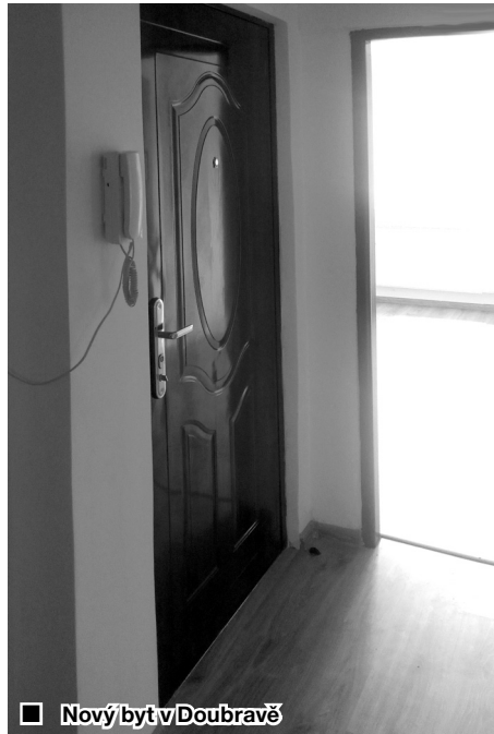
■ Nový byt v Doubravě

Je sice pravda, že v době, kdy píšete tento člán-