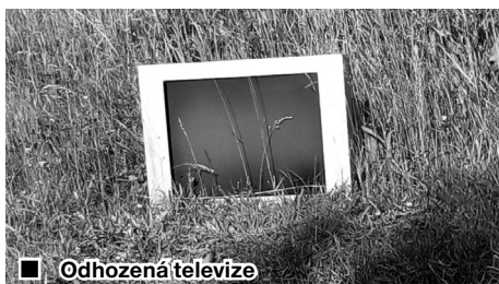
■ Odhozená televize