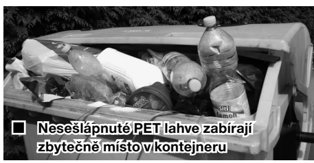
■ Nesešlápnuté PET lahve zabírají zbytečně místo v kontejneru