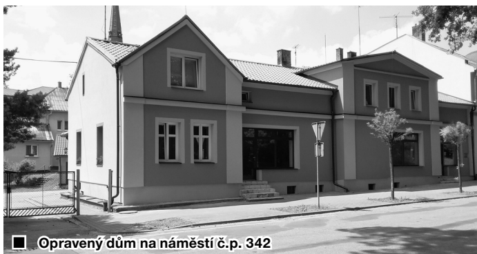
■ Opravený dům na náměstí č.p. 342