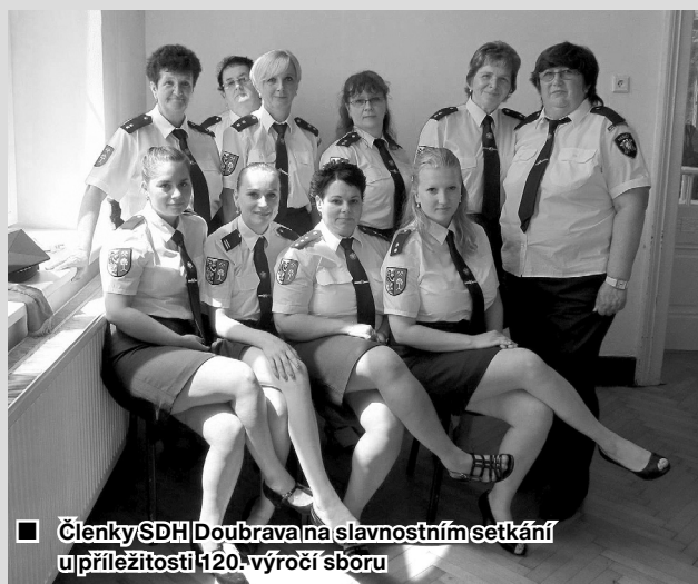
■ Členky SDH Doubrava na slavnostním setkání u příležitosti 120. výročí sboru

3. 6. se nám po trochu vydatnějším dešti opět zatopilo naše doubravské náměstí, a to hlavně nánosem hlíny z pozemku bývalého sadu nad hřbitovem. Po vytažení zanesených vík kanálů voda záhadně zmizela a s nánosem bahna si hravě poradila naše cisterna. Zasahoval Slávik P. a Šebesta R. V pondělí 4. 6. jsme se v dopoledních hodinách zúčastnili společně s dalšími jednotkami z okolí námětového cvičení na zimním stadionu v Orlové Lutyni, kde