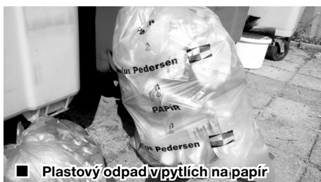
■ Plastový odpad v pytlích na papír