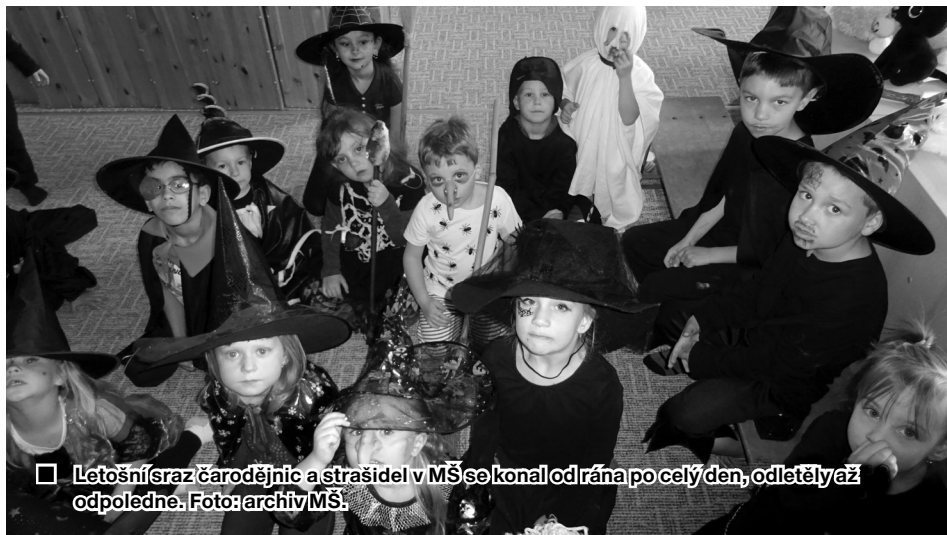
□ Letošní sraz čarodějnic a strašidel v MŠ se konal od rána po celý den, odletěly až odpoledne.