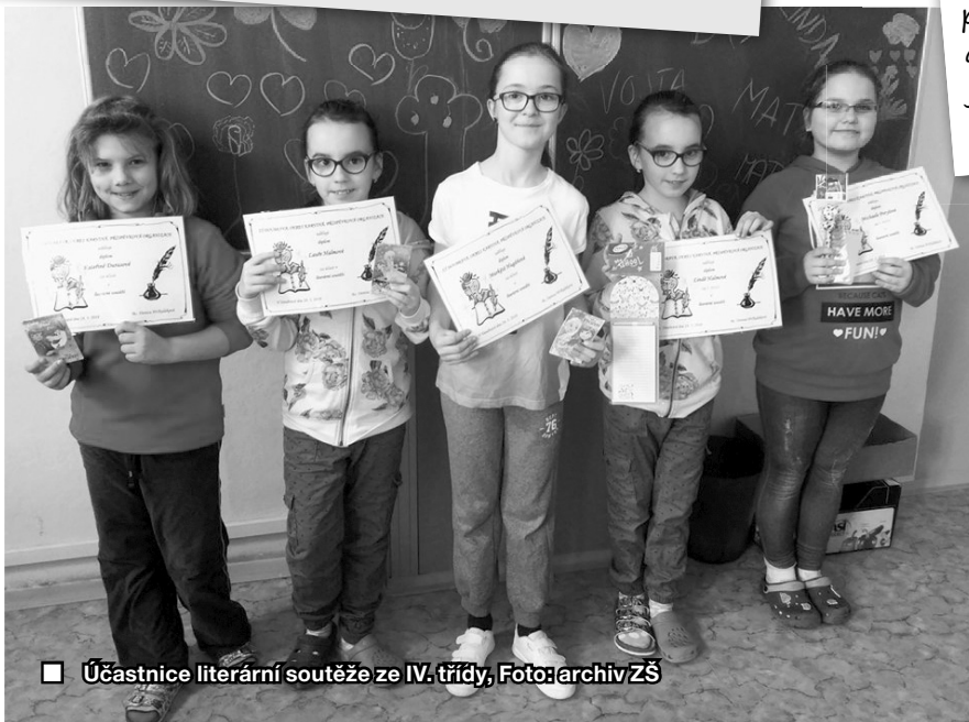
■ Účastnice literární soutěže ze IV. třídy