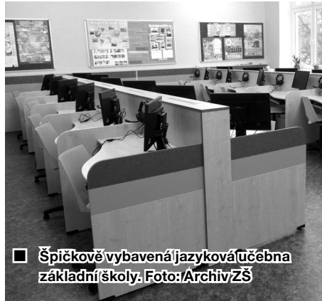
■ Špičkově vybavená jazyková učebna základní školy.

V Doubravě máme dvě příspěvkové organizace, jejichž zřizovatelem je obec. Jsou to naše mateřská a základní škola. Vzhledem ke skutečnosti, že v minulých letech Doubrava zaznamenala podstatný úbytek obyvatel, musí se naše základní škola vypořádat s malým počtem žáků. Malý počet žáků je dobrý v tom, že učitel má více času na to, aby se individuálně věnoval každému žákovi, což v přeplněné třídě bude dělat jen těžko a s vypětím všech sil. Vedení obce a doufám, že i všichni občané, chtějí tyto dvě organizace v obci zachovat. Nejen to,