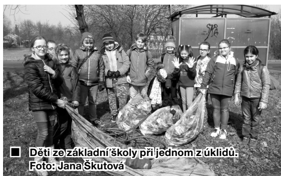
■ Děti ze základní školy při jednom z úklidů.

Děkujeme dobrovolníkům. Všichni, kteří se do této akce zapojili, odvedli pořádný kus práce. ŠH