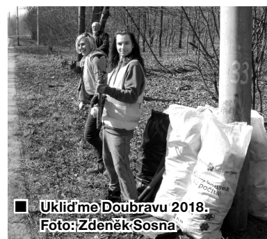
■ Uklidme Doubravu 2018.