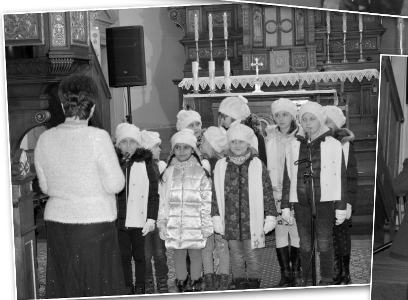
■ Adventní koncert