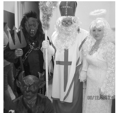
■ Každoroční Mikulášská nadílka, foto: Zdeněk Sosna