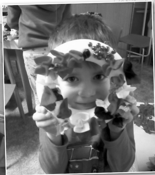
■ Vánoční tvoření s Doubraváčkem, foto: Kateřina Jachymčáková