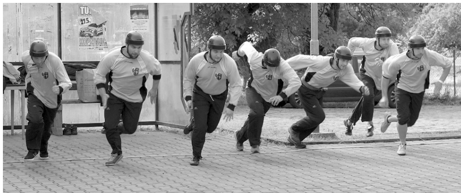
■ Družstvo na startu soutěže O putovní pohár starosty obce Doubrava.