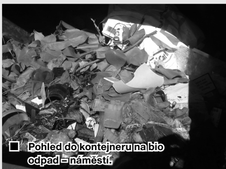
□ Pohled do kontejneru na bio odpad - náměstí.

po nich stále uklízet jejich nepořádek. Bohužel je situace už neúnosná, a proto bude obec monitorovat tyto prostory a konkrétní jedinci si jistě budou muset sáhnout hlouběji do svých kapes, jelikož tento úklid zaplatí ze svého. Předpokládám, že konkrétní člověk poznává své plastové židle postříkané barvou po malování včetně přepravek od pivních lahví. Odkud asi tak mohou být? Možná to je pro některé ještě tajemství, že obec Doubrava má sběrné místo, kam se má odvézt právě tento kusový odpad. Obec ho navíc odebírá zcela zdarma.