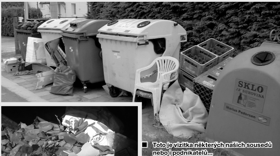
■ Toto je vizitka některých našich sousedů nebo i podnikatelů...

Pohled do kontejneru na bio odpad asi hovoří sám za sebe. Je tam totiž všechno, na co si vzpomeneme. Stejný stav je i v ostatních kontejnerech. Ovšem jak je vidět na fotografii, kontejnery v části Hranice hovoří samy za sebe, ještě je stále dost těch, kteří si myslí, že obec nebo někdo bude